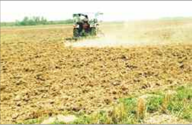
बिहारपुर में खेतों की जुताई करने के दौरान उड़ती धूल।