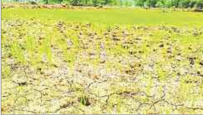
धान की नर्सरी में पड़ी दरारें।

स्थानीय प्रभाव से कहीं-कहीं छिटपुट वर्षा हो रही है जो धान की रोपाई के लिए पर्याप्त नहीं है। किसान द्यूबवेतल से खेतों