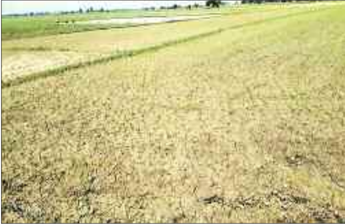
वर्षा की कमी से सुखती धान की फसल।